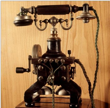
Telefon im Jahr 1900