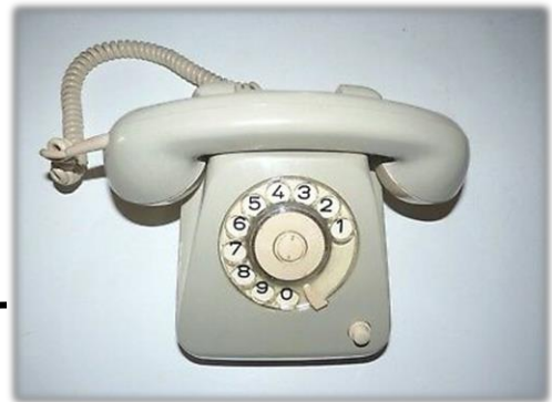
Telefon im Jahr 1965