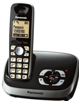
Telefon im Jahr 2001